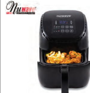
$99.99 "Air fryer" Nuwave® de 3 qts. Reg. $129.99 56051