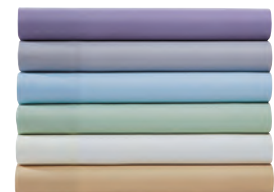
AHORRA 30% COLORMATE en juego de sábanas Colormate® de microfibra. Tamaños "Twin"- "Queen" Reg. $34.99-$59.99, esp. $23.99-$41.99 63250