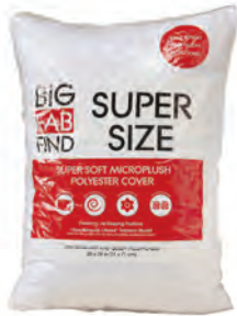
$4.99 Almohada Big Fab Find® Supersize Reg. $11.99 50606