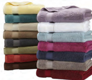
$14.99 c/u CANNON Toallas de baño Cannon® de algodón egipcio Reg. $25.99 c/u 95756