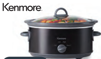
Socios pagan $29.99