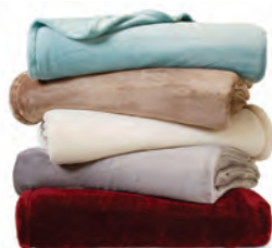
$19.99 c/u tamaños "full"- "king" Frazadas Grand Resort Collection en "plush" Reg. $45.99-$69.99 94047