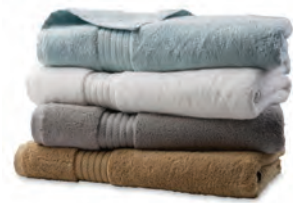
$17.99 c/u Toallas de baño Grand Resort® Reg. $28.99 c/u 93365