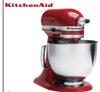
$349.99 Batidora de estante KitchenAid® Artisan® Series Empire Red de 5 qt. Reg. $549.99 47807