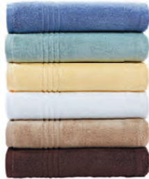
$6.99 c/u COLORMATE Toallas de baño Colormate® Soft and Plush Reg. $14.99 c/u 77811