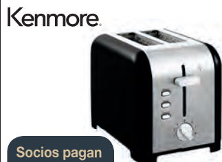
Socios pagan $29.99