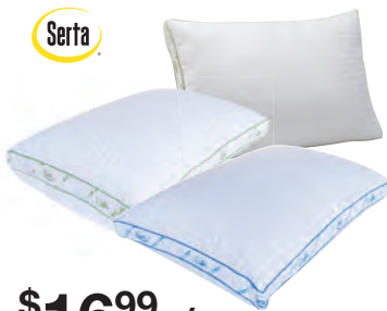
$16.99 c/u Almohadas hipoalergénica Serta® Smartloft Reg. $28.99 c/u 75070/958/959