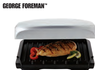
$49.99 Parrilla George Foreman™ de 60" •Superficie antiadherente Reg. $64.99 34150