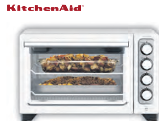
$99.99 Horno tostador KitchenAid® de 12" •Convección Reg. $149.99 70265